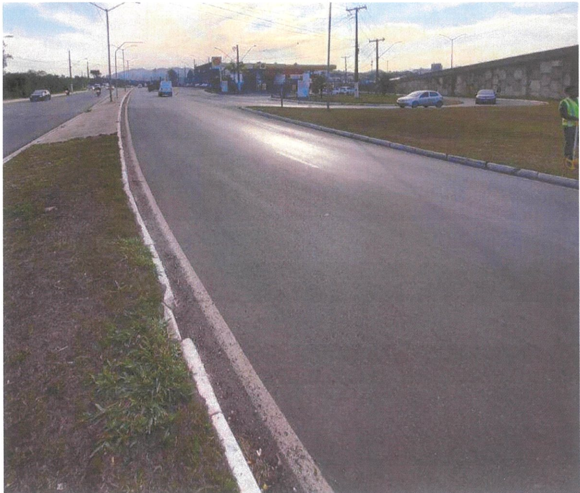
Local Fiscalizado Bairro/Centro