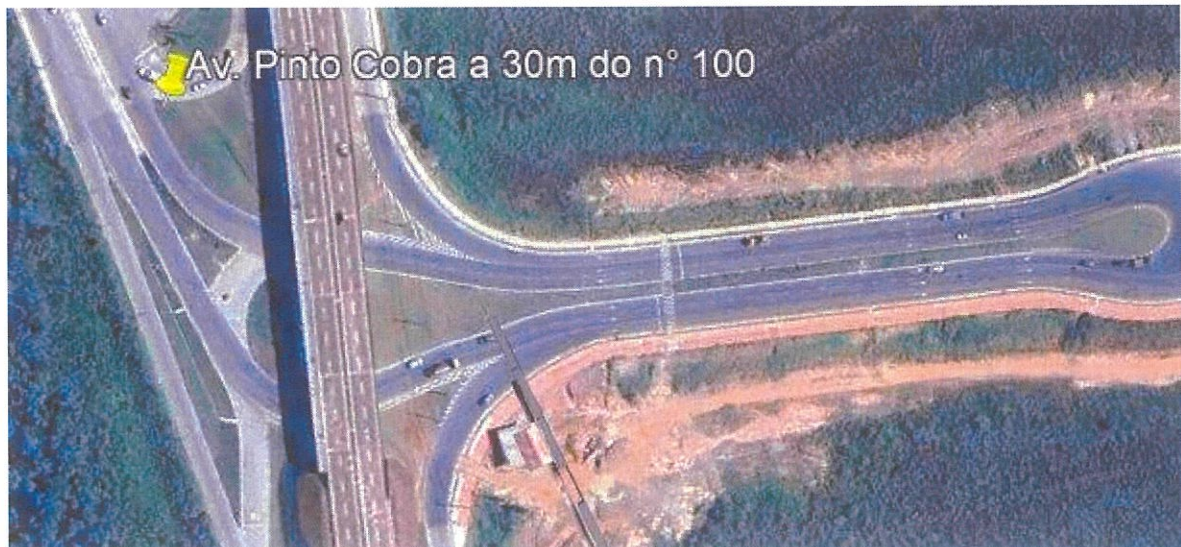
Vista Superior