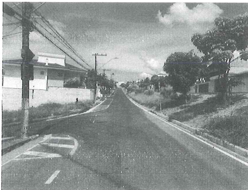
Vista do local.

Praça João Pinheiro, 73 - Centro, Pouso Alegre - MG, 37.550-191