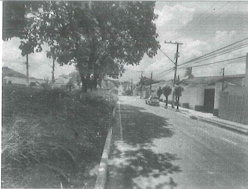
Vista do local.