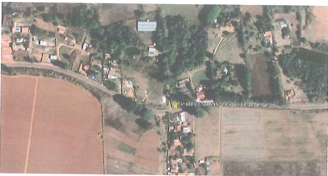
Vista Superior – Fonte: Google Earth