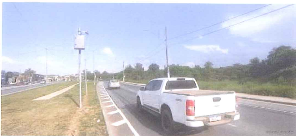
Local Fiscalizado (Centro / Bairro)