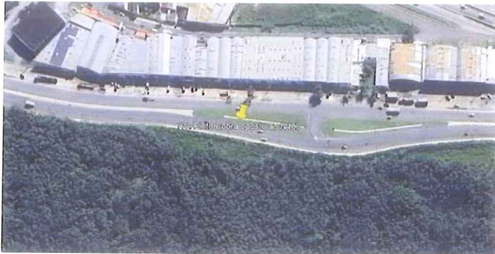
Vista Superior