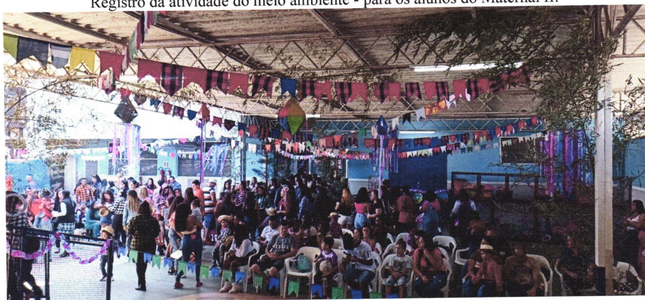
Registro da festa Julina.