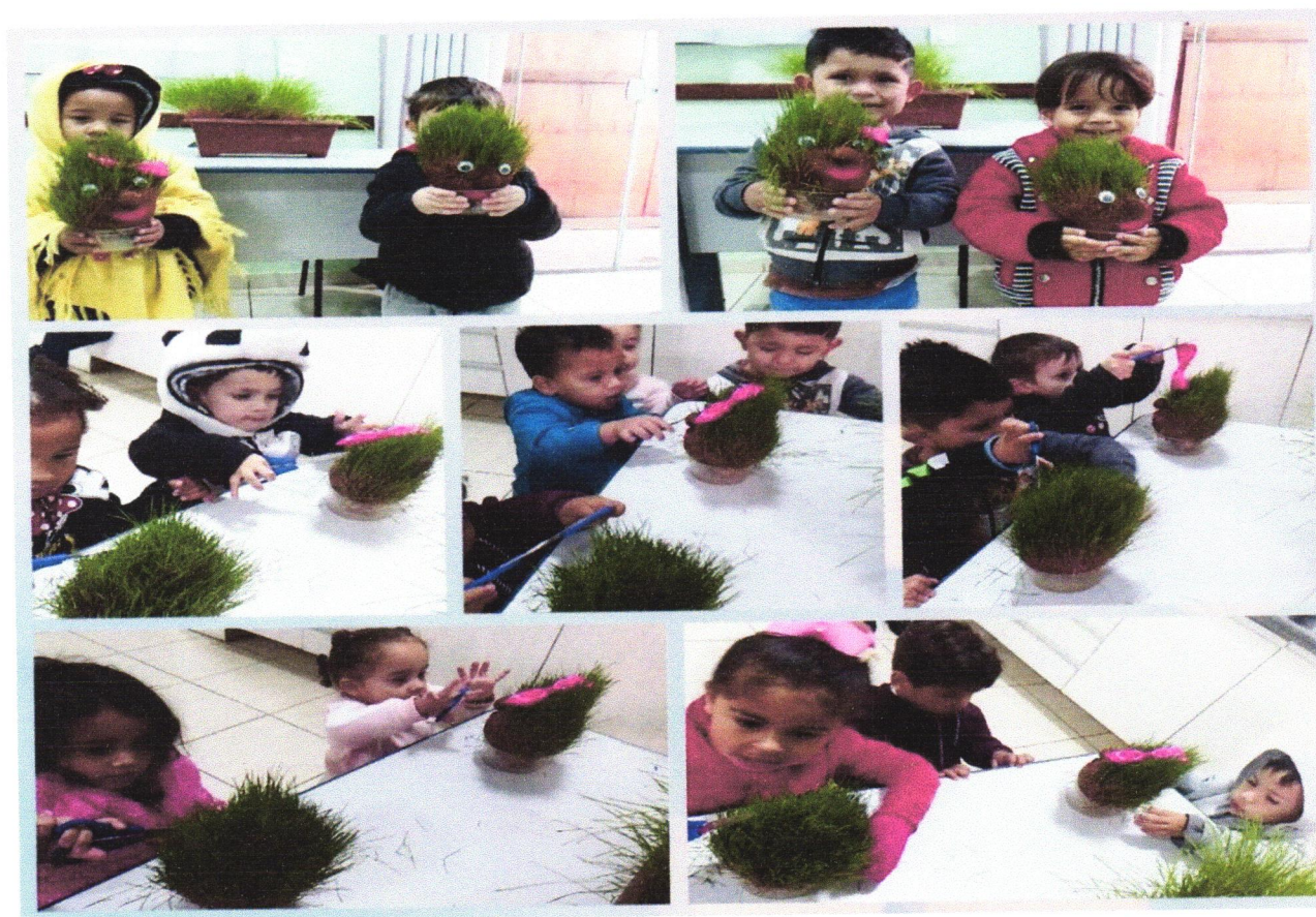
Registro - Oficina: cortando os cabelinhos dos bonecos de alpiste.

Meio ambiente: Os alunos ficaram entusiasmados com os bonecos uns dos outros, foi trabalhada a germinação, o cuidado diário com o ser vivo e com todos os bonecos tiveram seus cabelinhos crescidos.