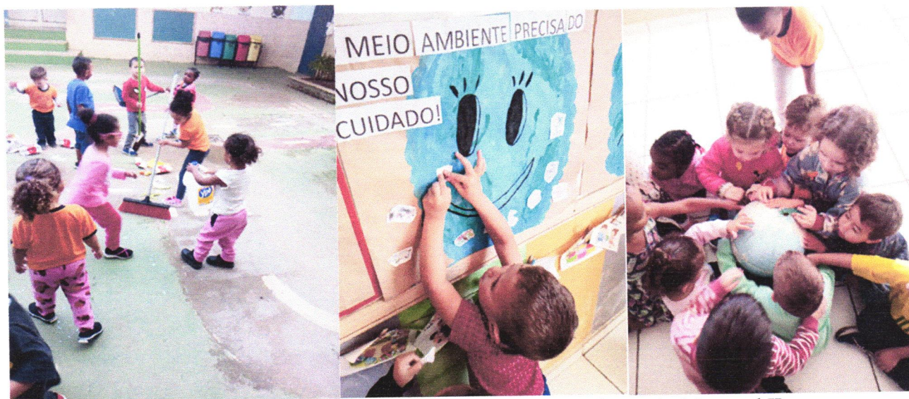
Registro da atividade do meio ambiente - para os alunos do Maternal II.