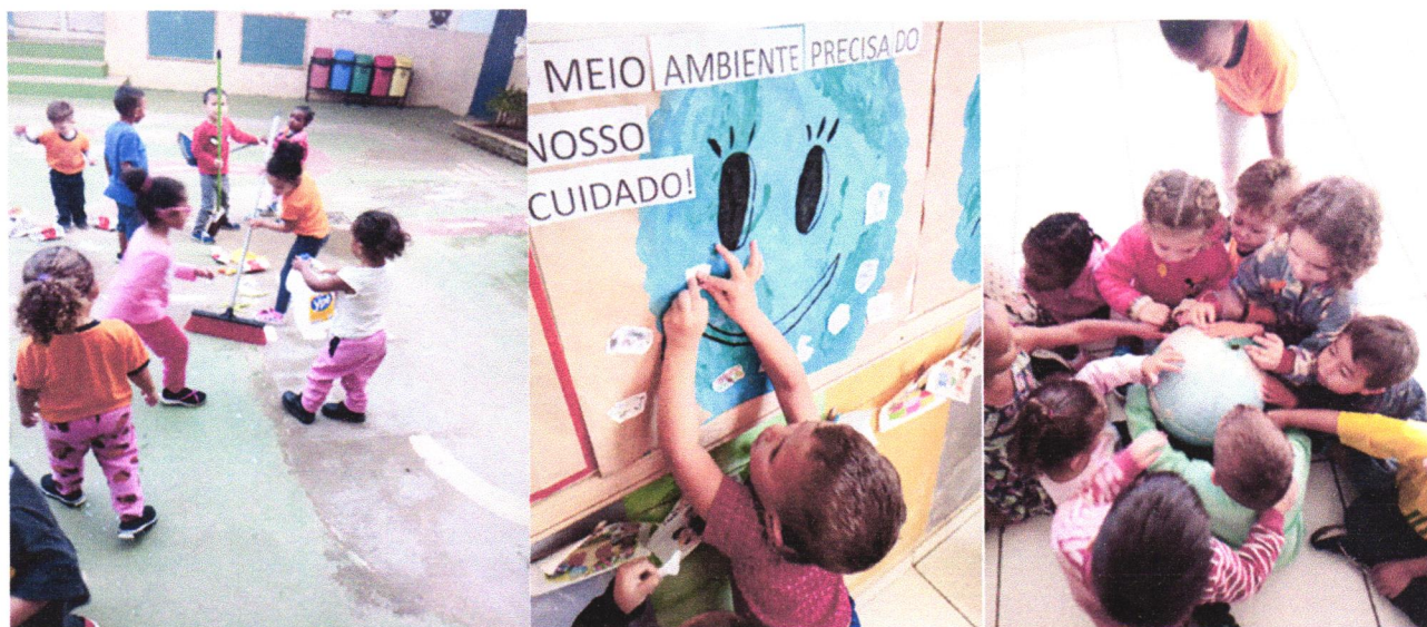
Registro da atividade do meio ambiente - para os alunos do Maternal II.