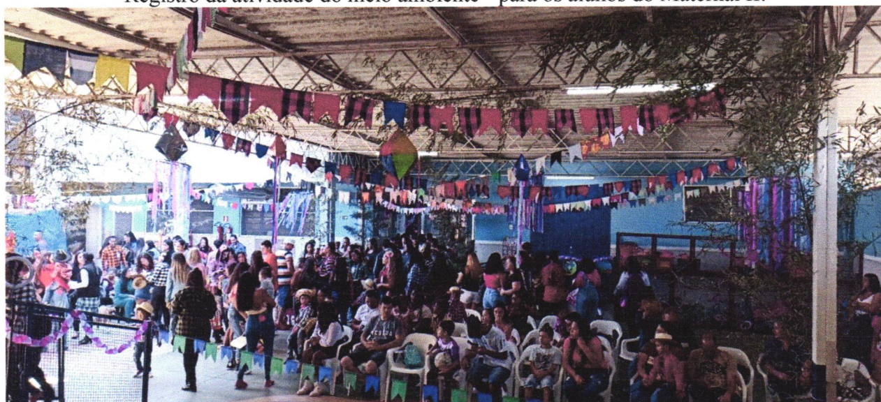
Registro da festa Julina.