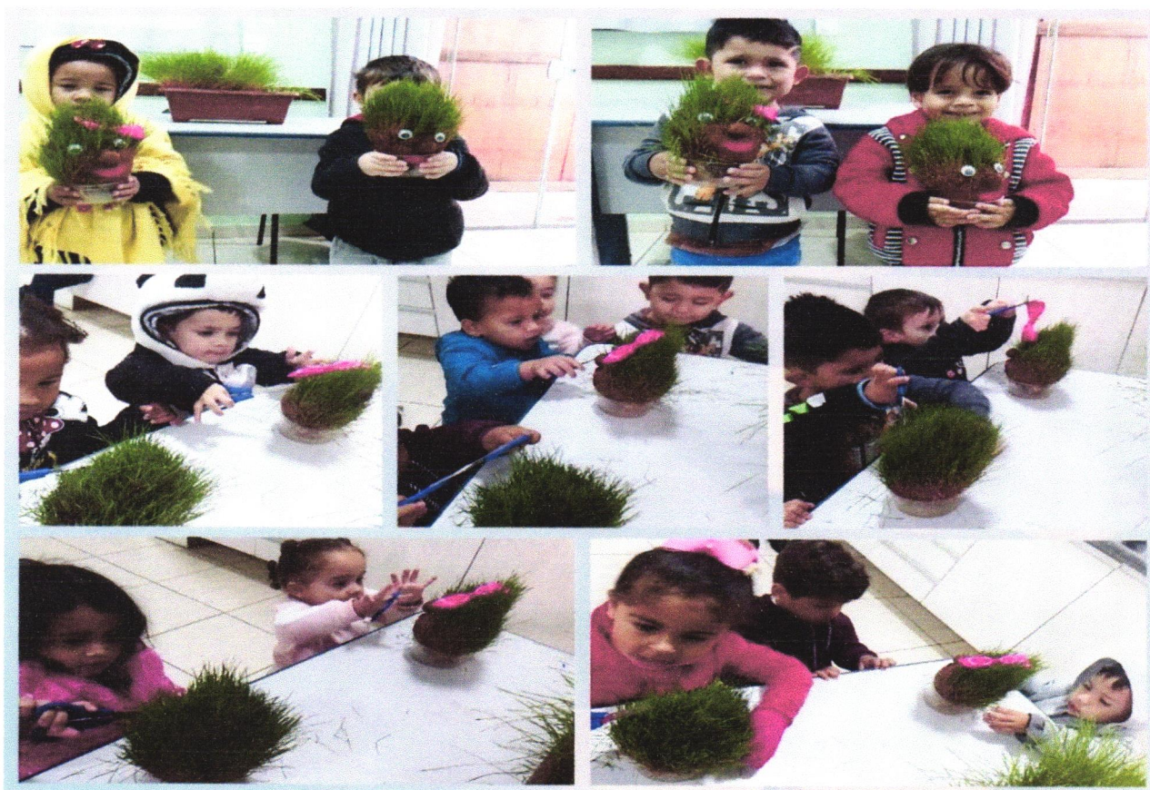
Registro - Oficina: cortando os cabelinhos dos bonecos de alpiste.

Meio ambiente: Os alunos ficaram entusiasmados com os bonecos uns dos outros, foi trabalhada a germinação, o cuidado diário com o ser vivo e com todos os bonecos tiveram seus cabelinhos crescidos.