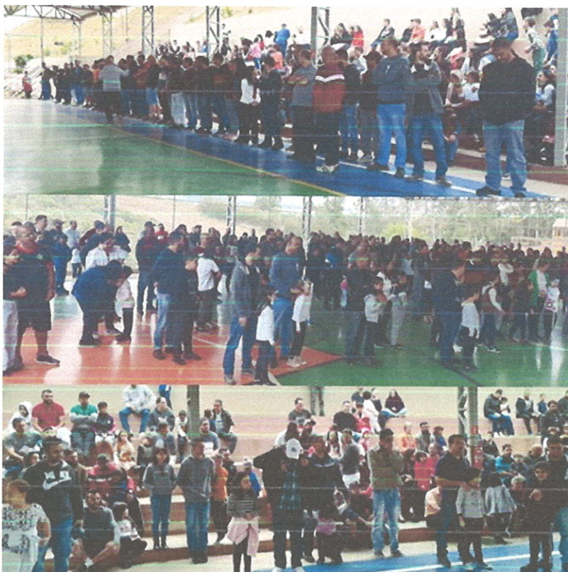
Comemoração "Dia dos pais 2022." Participação dos pais em uma gincana esportiva.