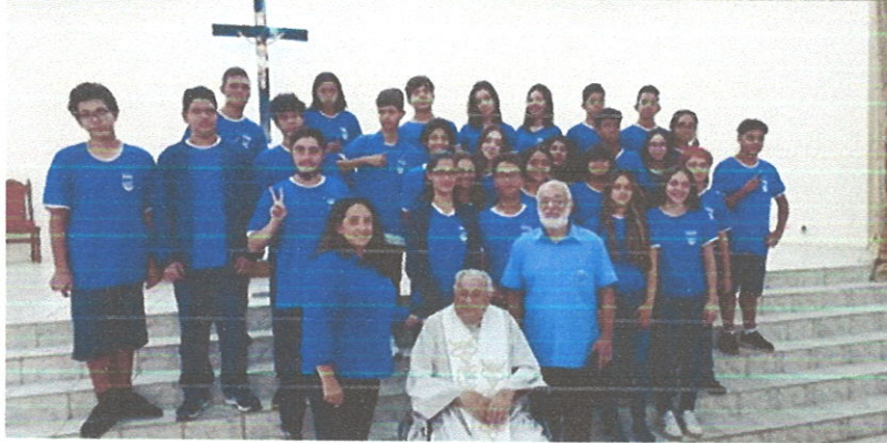
Participação dos alunos na Missa de encerramento do ano letivo de 2022 e Missa de Formatura dos alunos do 9º ano.