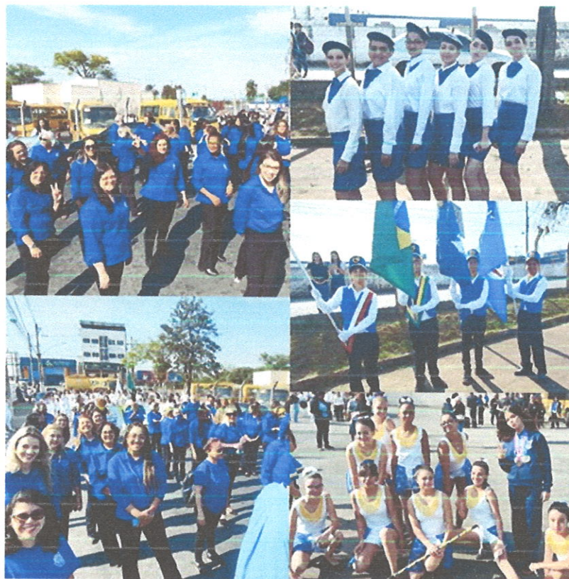
Participação da Escola no Desfile Cívico de 7 de Setembro