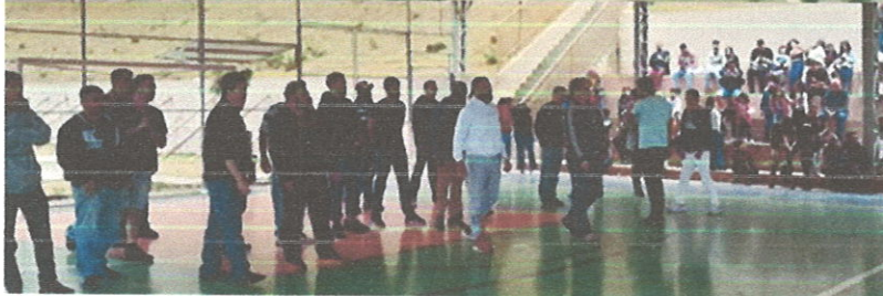
Comemoração “Dia dos pais 2022.” Participação dos pais em uma gincana esportiva.