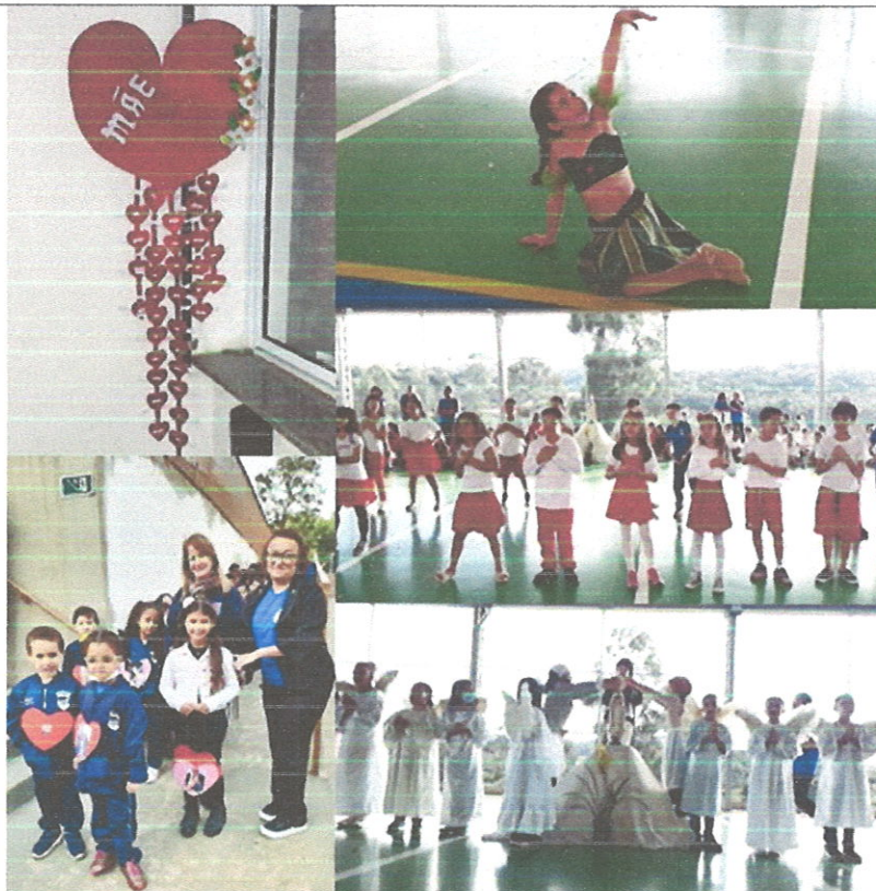
Comemoração "Dia das mães 2022."