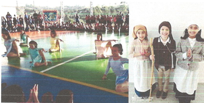
Comemoração “Dia das mães 2022.”