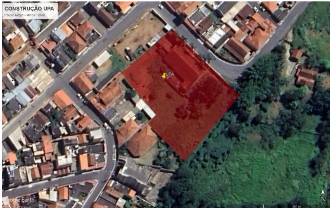
Figura 2: Localização onde será construído a UPA – São João