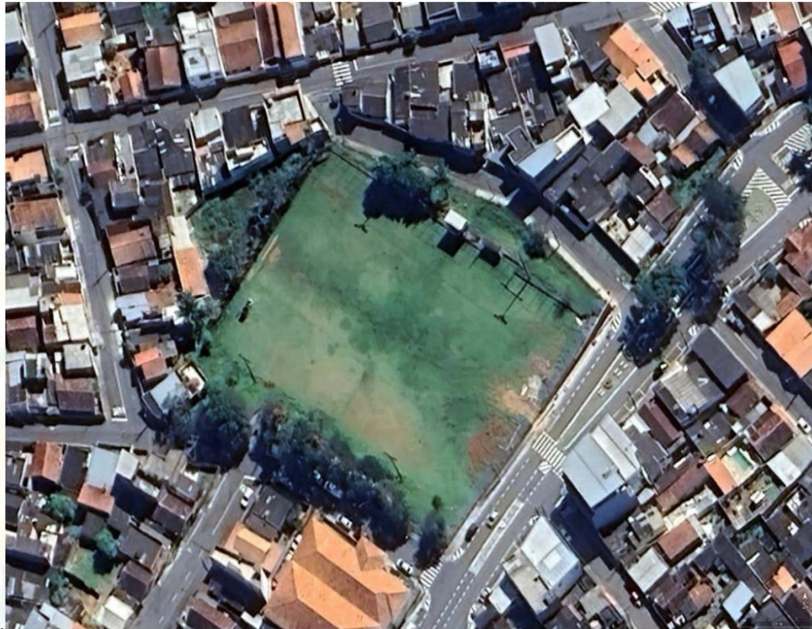
Figura – Campo de Futebol São João - CÓI.

9.1. O Campo de Futebol São João - CÓI, fica localizado na Avenida Uberlândia, bairro São João, Pouso Alegre - MG, conforme o previsto no Projeto Executivo e demais documentos anexos ao Projeto Básico e no Edital de Licitação.