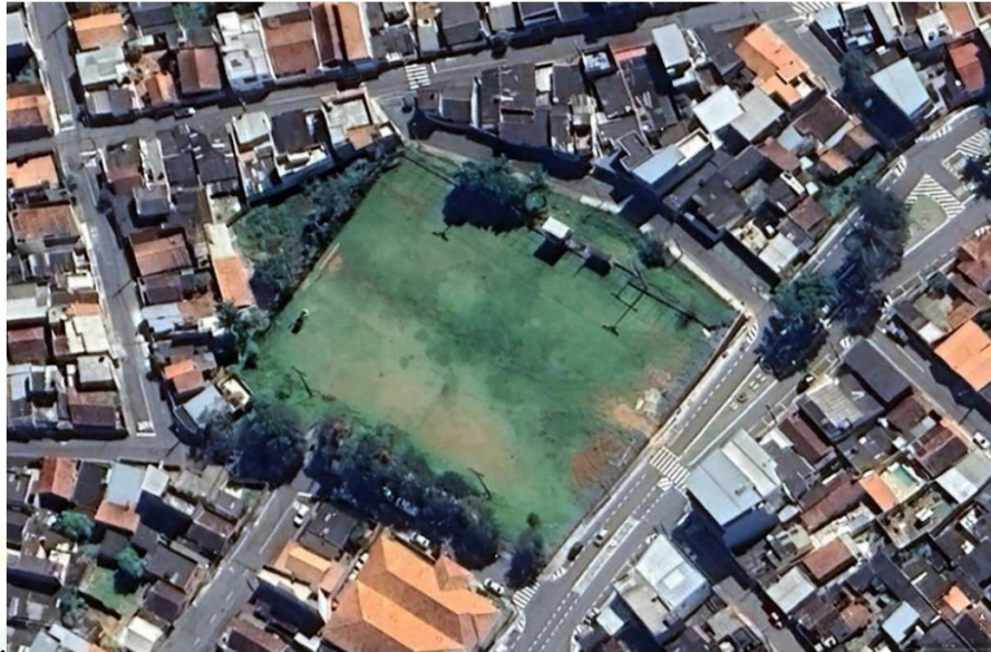
Figura – Campo de Futebol São João - CÓI.