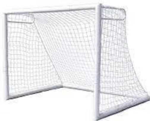
Figura 8-1 - Trave de Futebol com rede

As traves deverá ser instalada após o término da instalação da grama, a pintura das traves será na cor branca, conforme a Figura 8-1