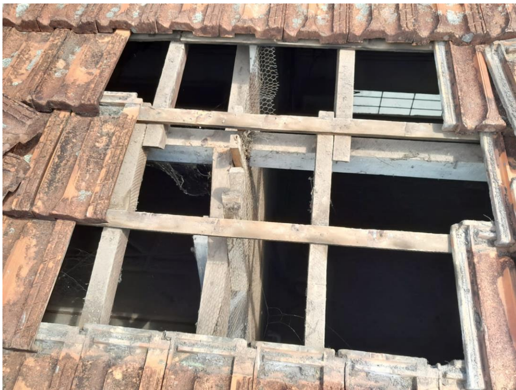
Figura 2: Manutenção em peças de madeira no telhado do departamento de limpeza