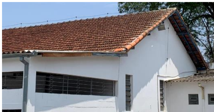
Figura 4: Almoxarifado