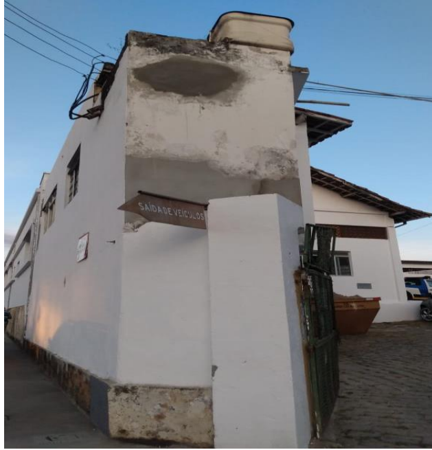
Figura 2: Portão do Departamento de Limpeza