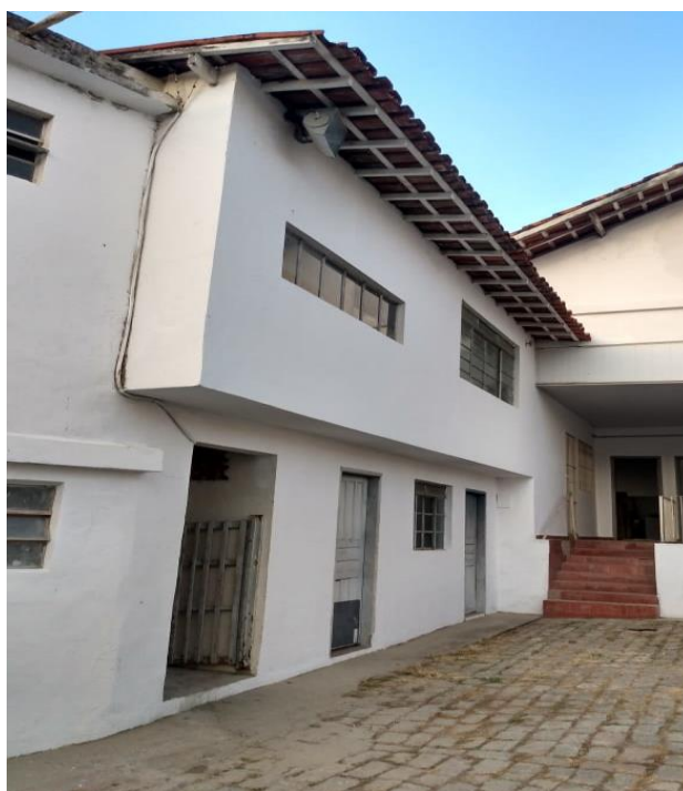
Figura 1: parte do depósito e políticas sociais no departamento de limpeza

Abaixo seguem algumas fotos mostrando o departamento de limpeza e as áreas onde o telhado é cerâmico.