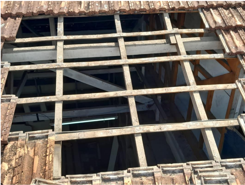
Figura 1: Manutenção em peças de madeira no telhado do departamento de limpeza