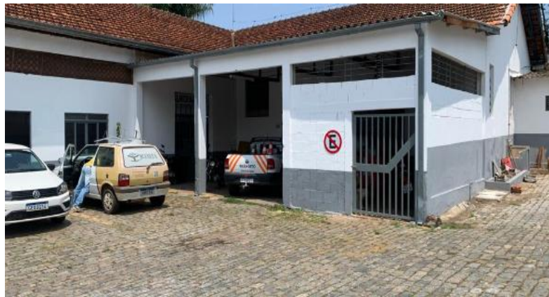
Figura 3: Depósito e fiscalização