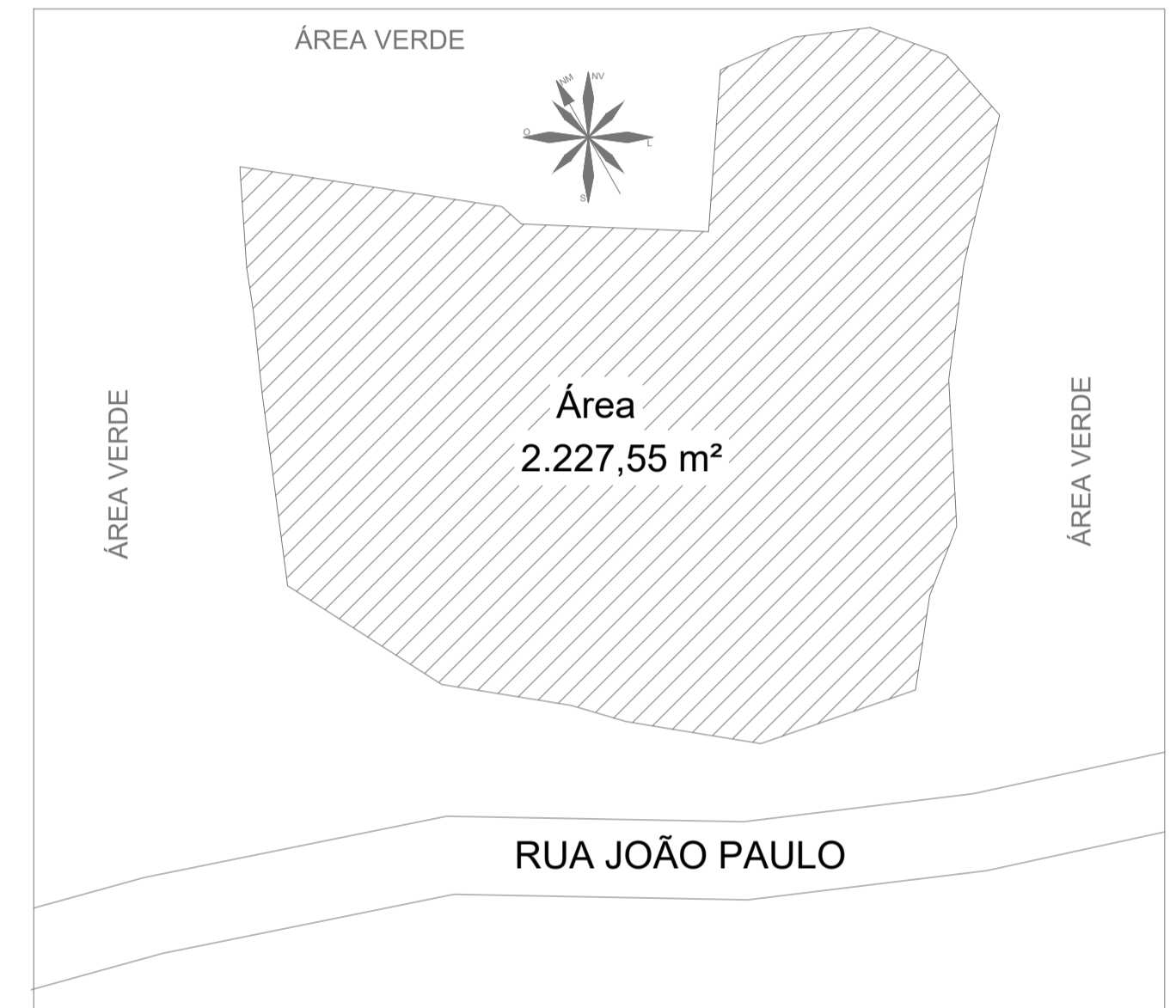
LOCAÇÃO Escala: 1:500