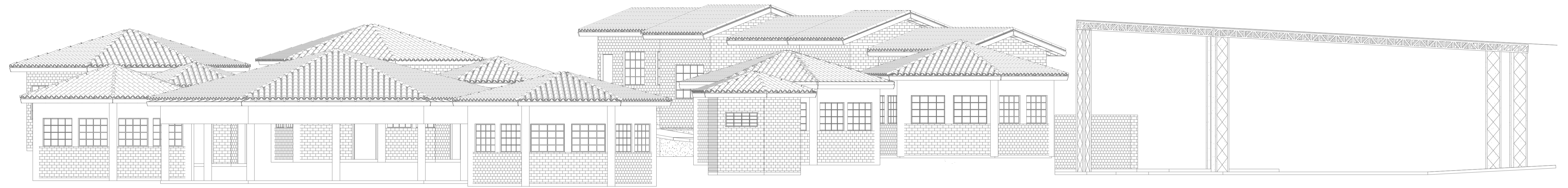
FACHADA Escala: 1:75