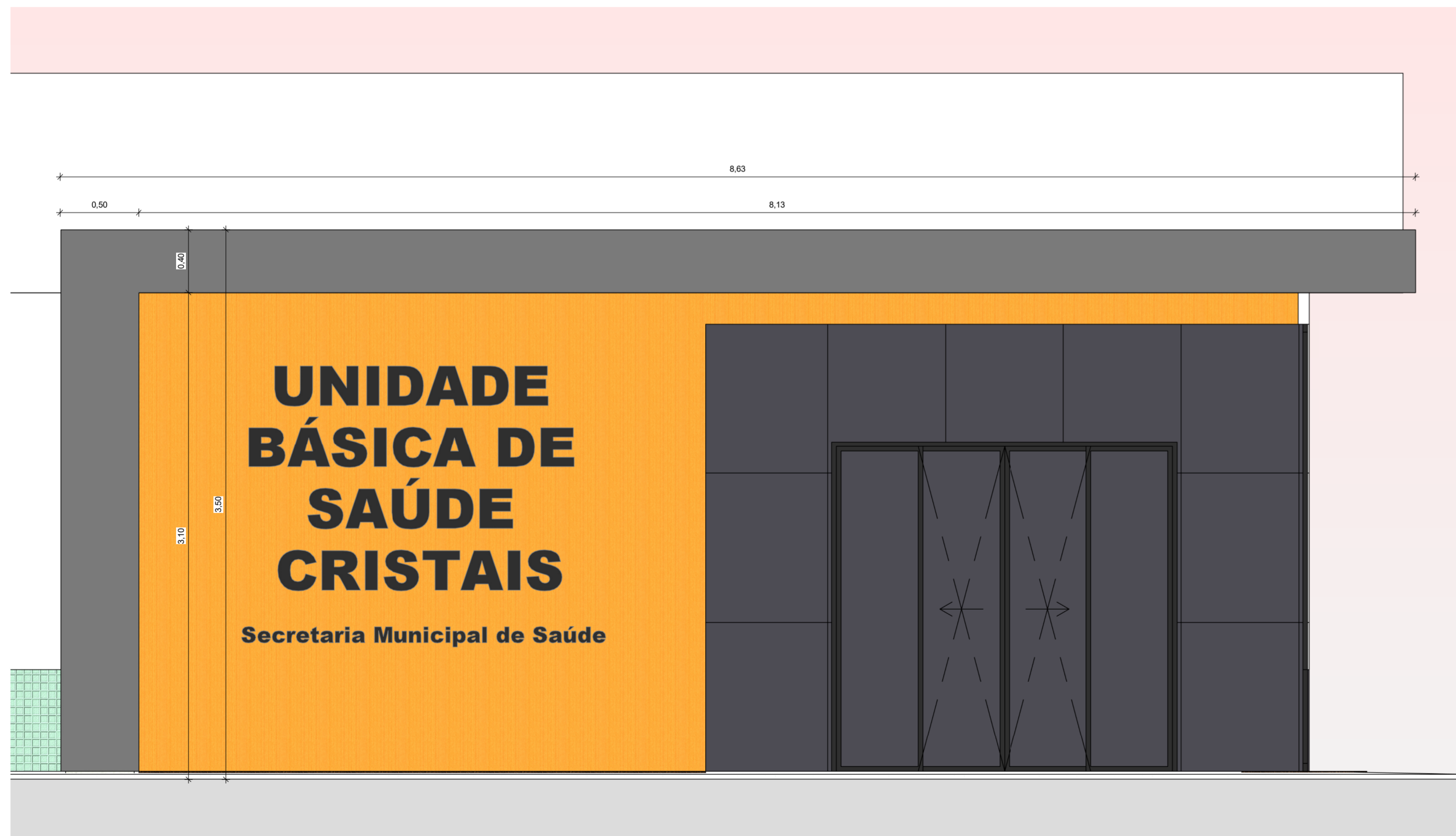
3 DETALHE DE FACHADA - VISTA 1 1 : 25