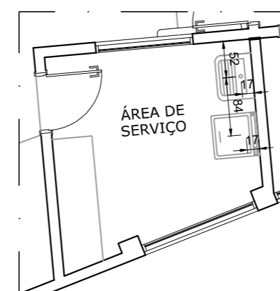
DETALHE ÁREA DE SERVIÇO Escala: 1:75