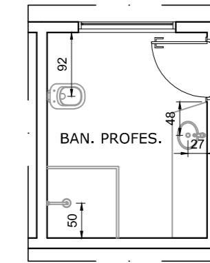
DETALHE BANHEIROS PROFESSORES Escala: 1:75