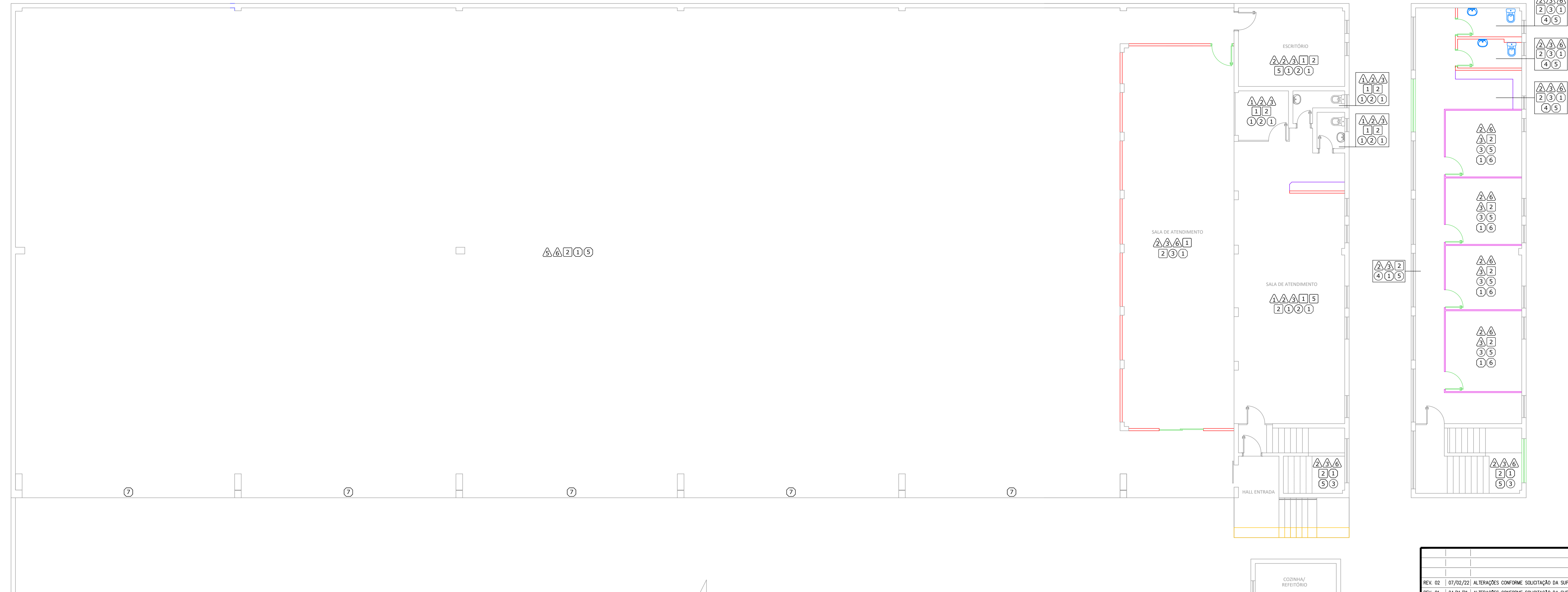
PLANTA BAIXA GALPÃO Escala: 1:75