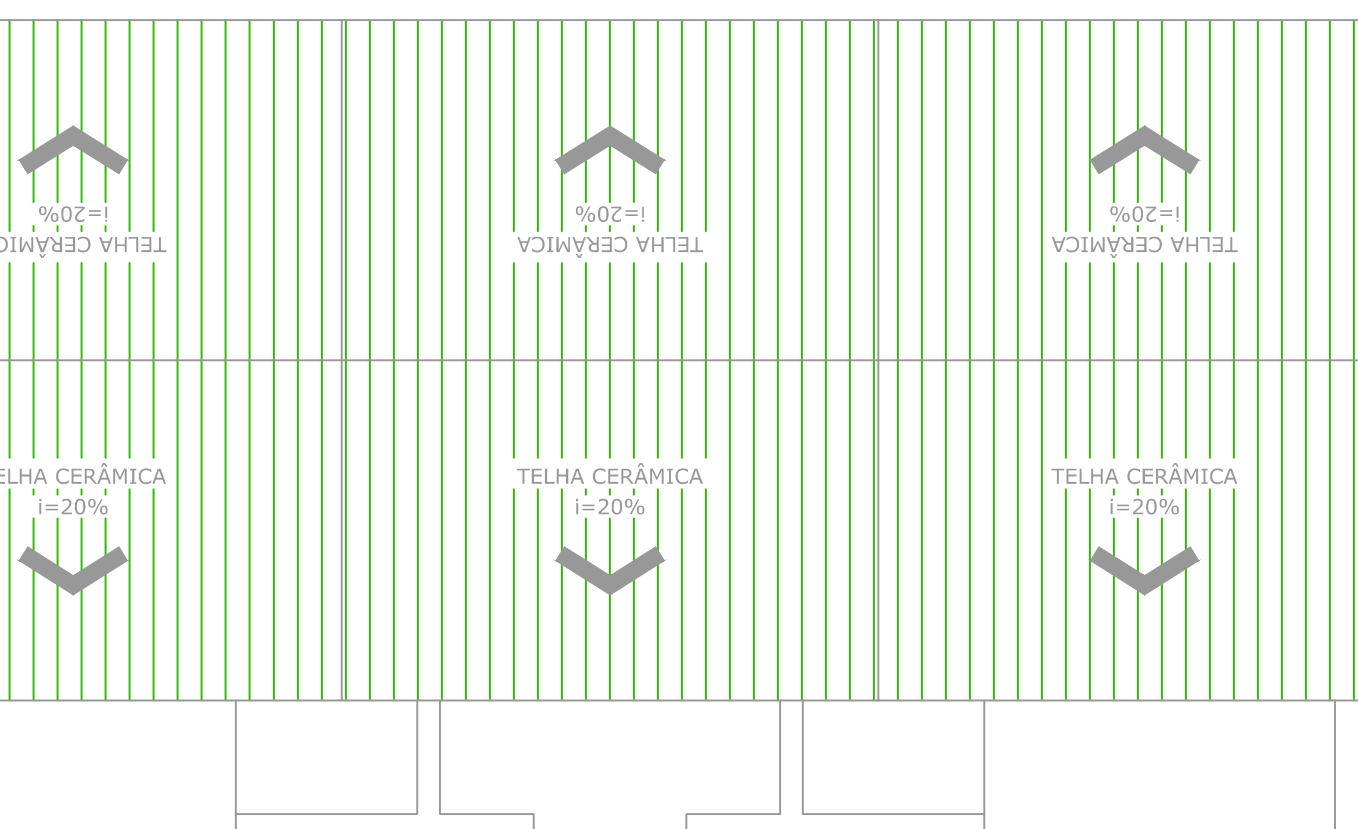
PLANTA BAIXA COBERTURA Escala: 1:50