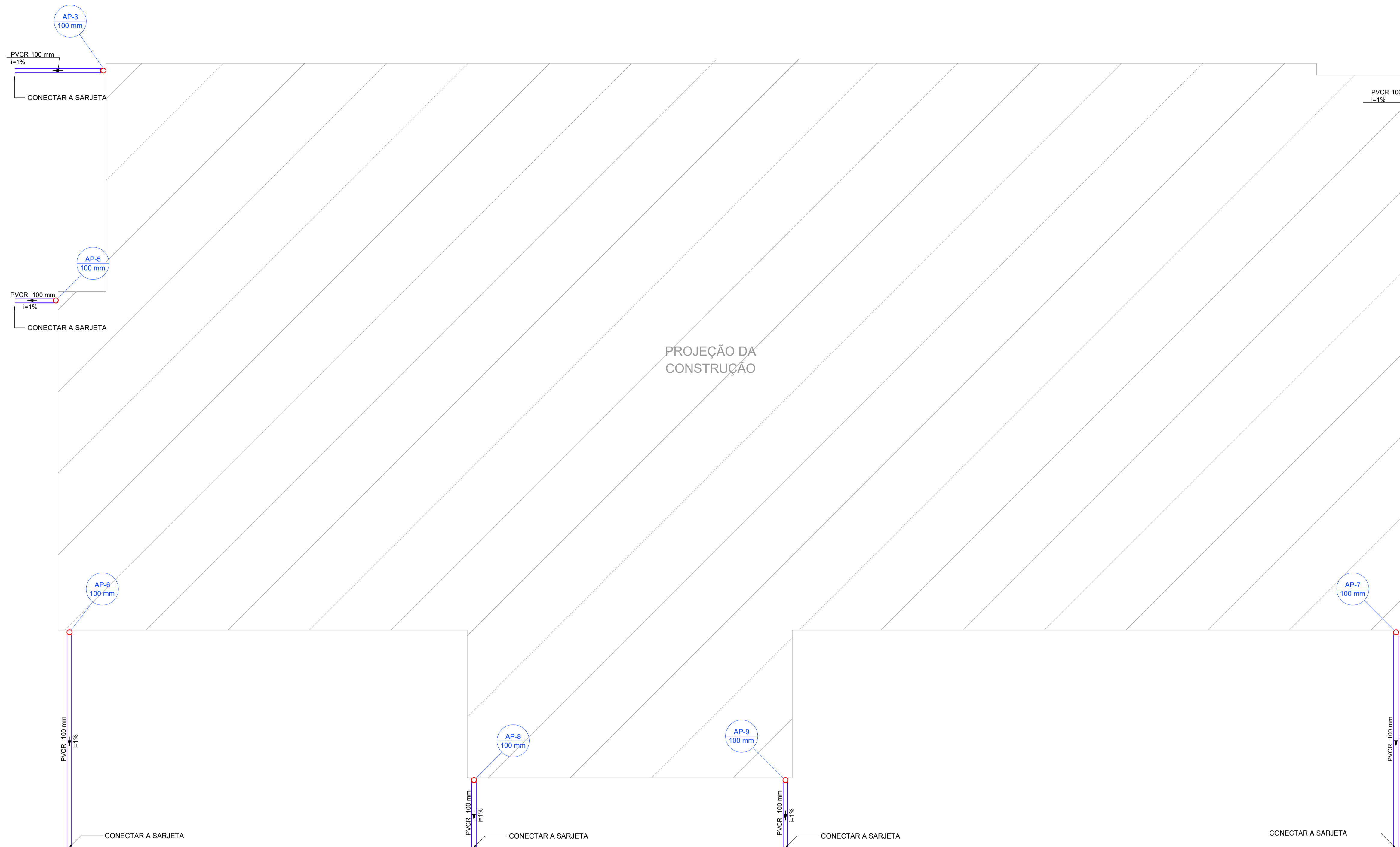
PLANTA BAIXA TÉRREO Escala 1:50