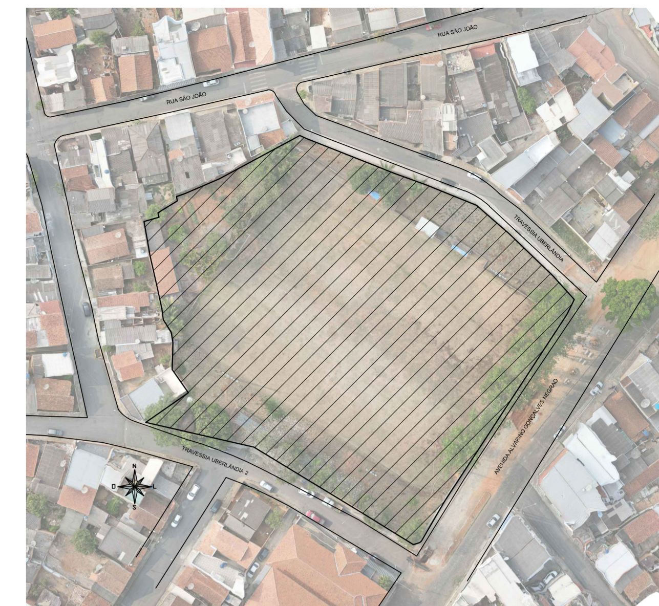
SITUAÇÃO Escala: 1:1000