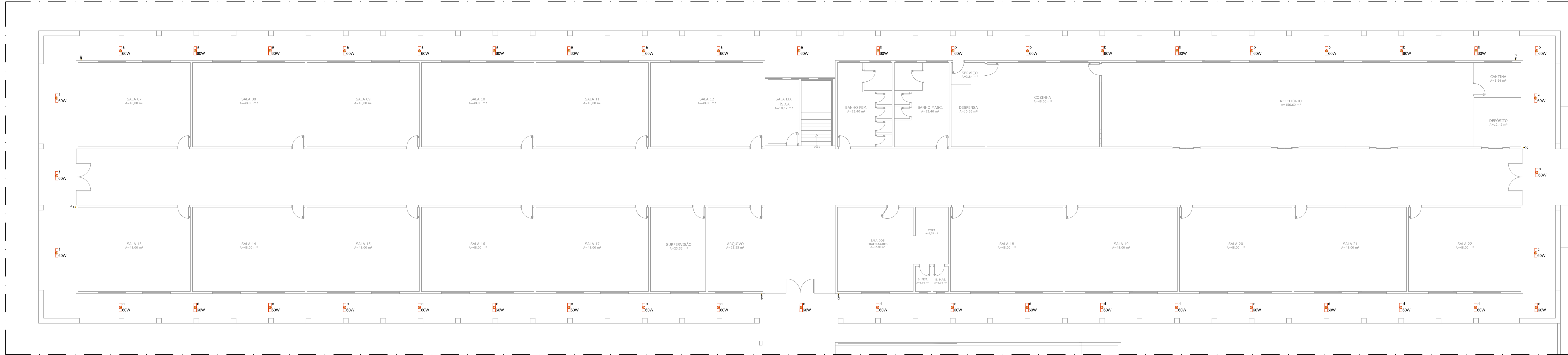
PLANTA BAIXA - PAVIMENTO TÉRREO ESCALA 1:100