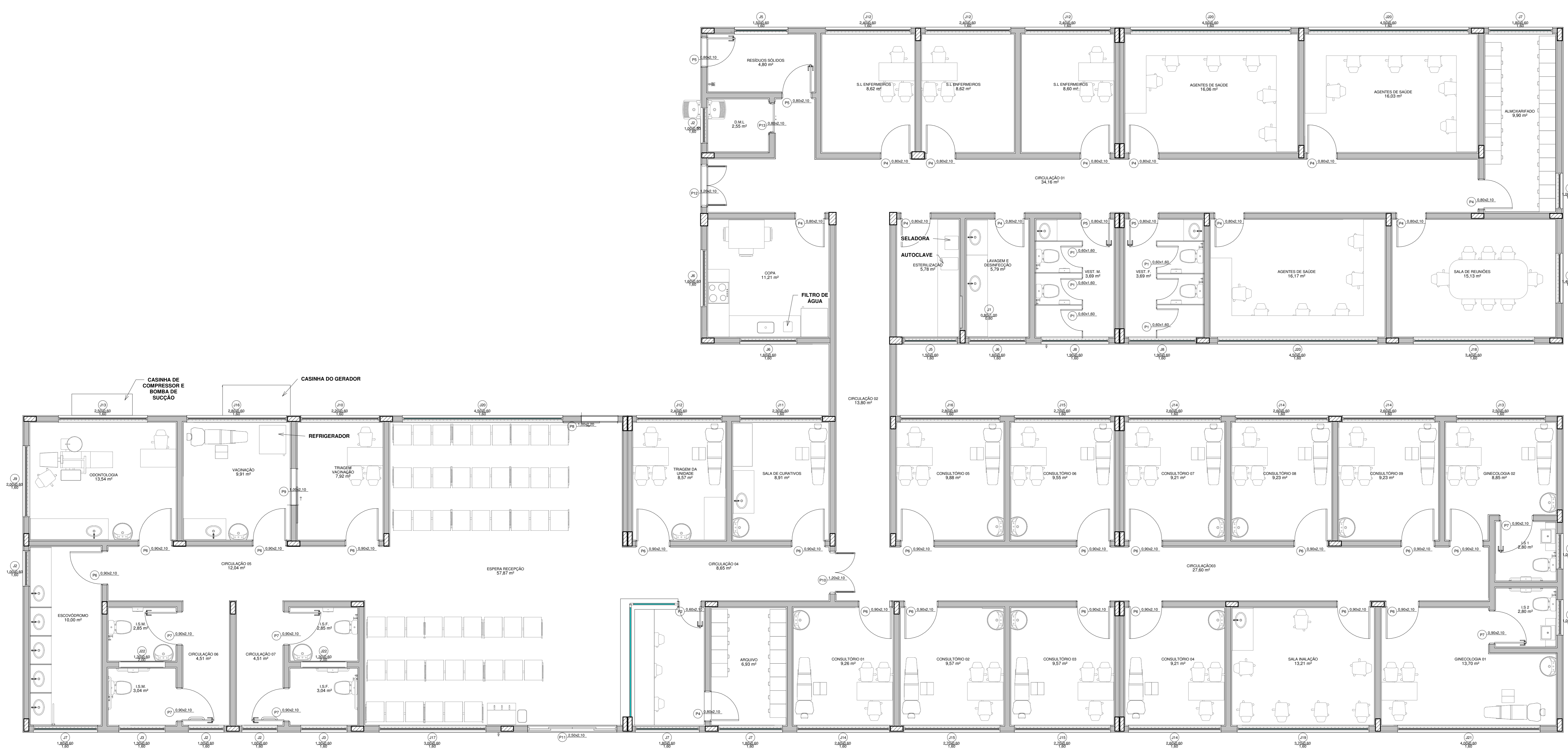
3 PLANTA LAYOUT 1 : 50

NOTAS: - VERIFICAR DETALHES CONSTRUTIVOS PERTINENTES NAS PRANCHAS DE DETALHAMENTO. - ALTERAÇÕES NESTE PROJETO SOMENTE COM AUTORIZAÇÃO EXPRESSA DA EMPRESA PROJETISTA. - CONSIDERAR PEITORIS PARA TODAS AS JANELAS EM GRANITO; - CONSIDERAR SOLEIRAS PARA AS PORTAS DE ENTRADA EM GRANITO; - DETALHES DO MURO SE ENCONTRAM NO PROJETO ESTRUTURAL; - ALVENARIA DA PLATIBANDA AMARRADA POR CINTA SUPERIOR EM BLOCO DE CONCRETO EM FORMATO U; - REALIZAR EMBOÇO COM ADITIVO IMPERMEABILIZANTE EM TODAS AS PAREDES DOS VESTIÁRIOS; - APLICAR RESINA ACRÍLICA IMPERMEABILIZANTE NAS FACES DAS PAREDES INDICADAS NA PLANTA DE PAGINAÇÃO CONSIDERANDO REGIÕES DE PIS H = 1,20 M E BOX DOS VESTIÁRIOS H = 1,80 M. ALEM DE TODO O PERÍMETRO COM H = 0,30 M E AS ÁREAS DE PISO; - EXECUTAR REGULAGEM CONTRAPISO DE TODAS AS ÁREAS MOLHADAS COM ADITIVO IMPERMEABILIZANTE.