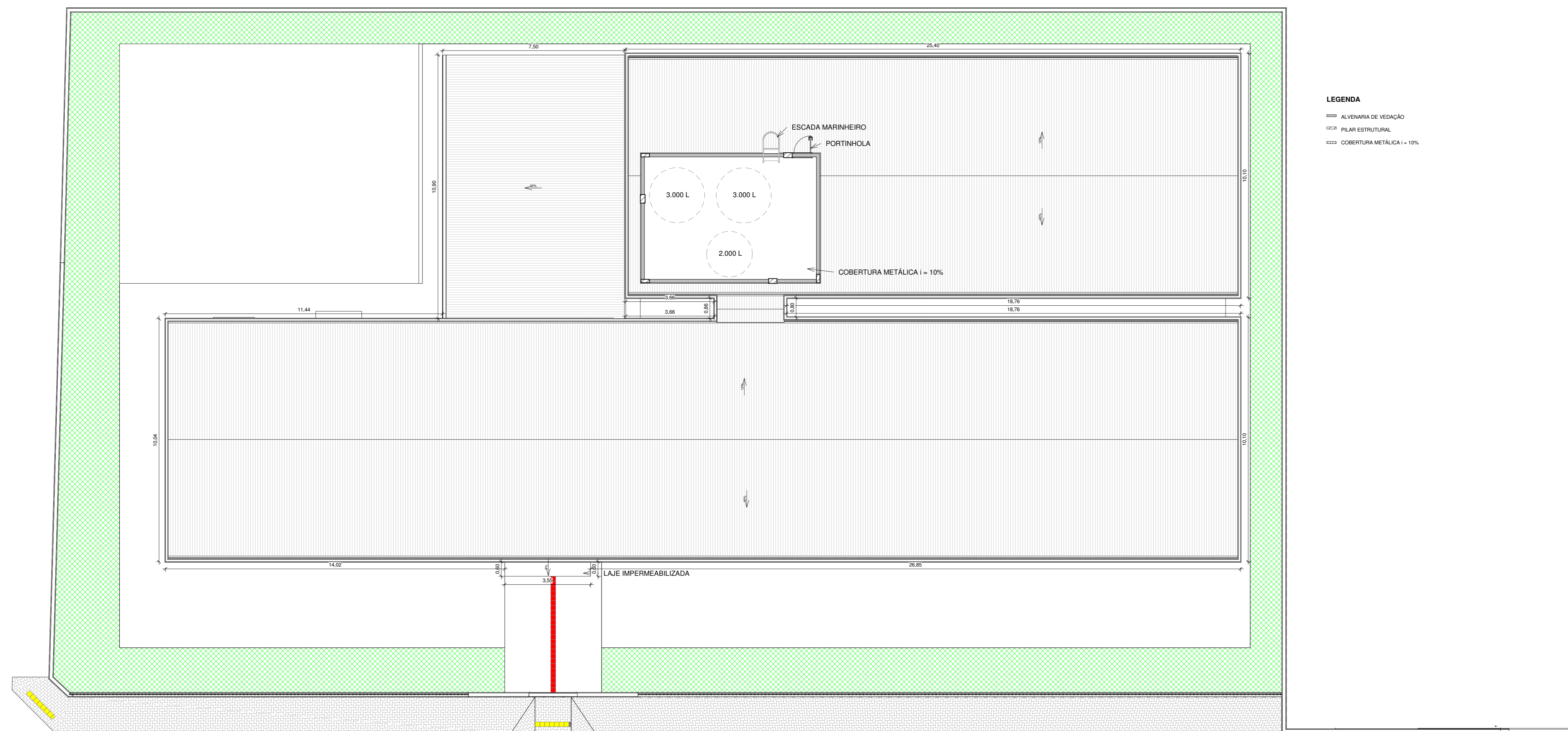
1 PLANTA BAIXA COBERTURA CAIXA D'ÁGUA 1 : 100

LEGENDA --- ALVENARIA DE VEDAÇÃO --- PLACA ESTRUTURAL --- COBERTURA METÁLICA 1 = 10%