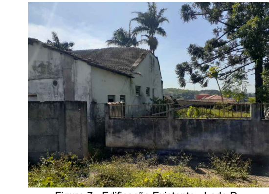
Figura 7 - Edificação Existente - Lado D