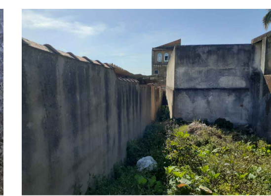
Figura 3 - Edificação Existente - Lado B