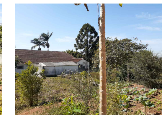
Figura 5 - Edificação Existente - Lado C (2)