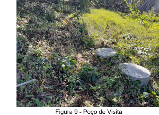
Figura 9 - Poço de Visita