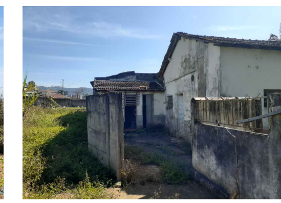
Figura 6 - Edificação Existente - Lado C (3)