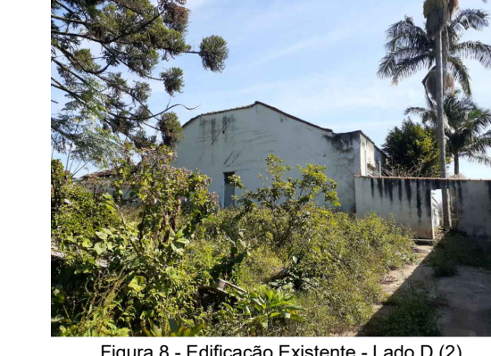
Figura 8 - Edificação Existente - Lado D (2)