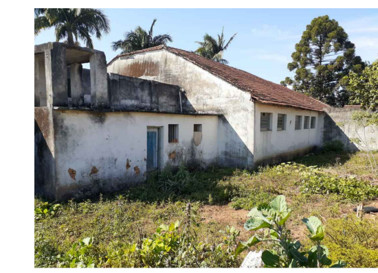
Figura 4 - Edificação Existente - Lado C