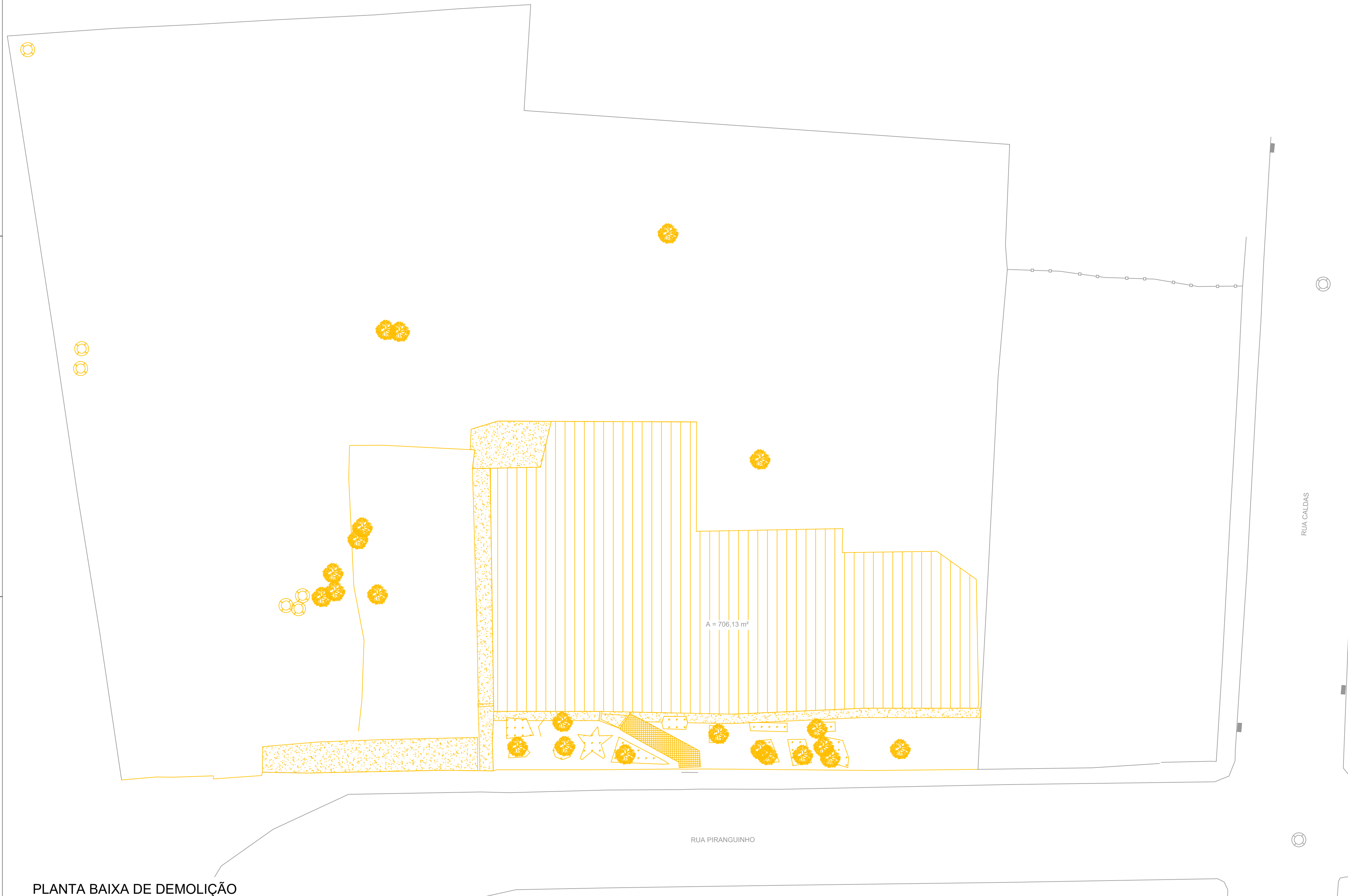
PLANTA BAIXA DE DEMOLIÇÃO Escala: 1:200