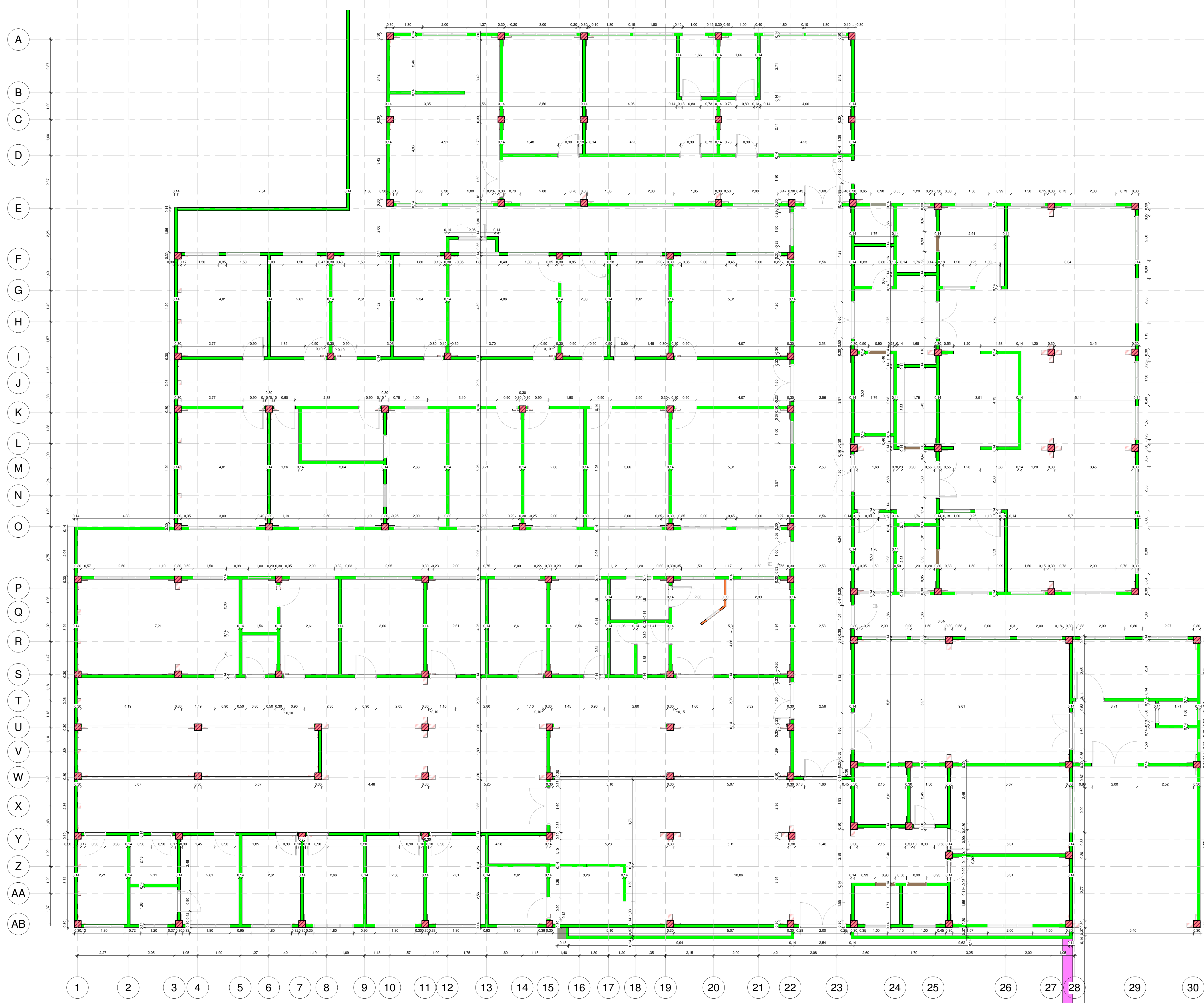
1 ALVENARIA 1:75