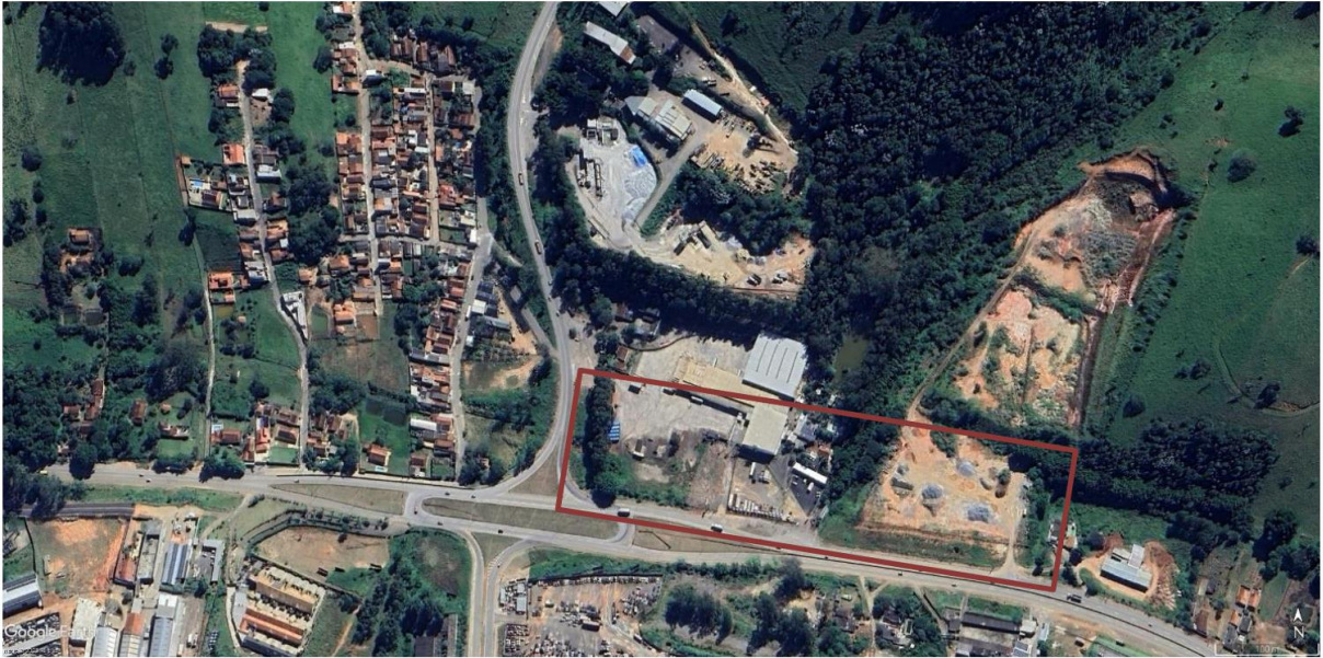
Figura 2 – Área de Abrangência do Projeto – Drenagem São Judas Tadeu.