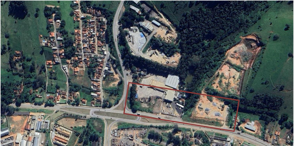
Figura 1 – Área de Abrangência do Projeto – Drenagem São Judas Tadeu.

14.1. Os serviços serão executados no seguinte local: Rodovia BR-459, bairro São Judas Tadeu, no município de Pouso Alegre – MG.