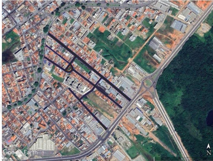
Figura 1 – Área de Abrangência do Projeto.

14.1. Os serviços serão executados nas ruas: Rua Alvarenga Peixoto, Rua Pe. Rolim, Rua Lino Amaral de Paula, Rua Raimundo A. Chaves, Rua Orlando Silva, Rua Dr. Antônio José Ribeiro e Avenida Jacy Laraia Vieira, conforme figura a seguir.