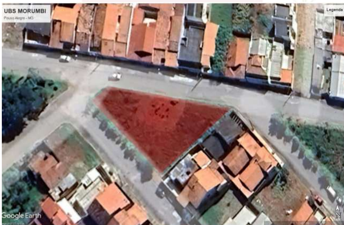
Figura 1-1 - Localização da UBS Morumbi

14.1. A construção da Unidade Básica de Saúde Morumbi será executada na Rua Júlio Cesar Huhn – Morumbi, município de Pouso Alegre, CEP 37561-184, nas coordenadas -22.293704, -45.910336. Esta UBS foi projetada considerando as características estabelecidas pelo Ministério da Saúde adaptada à área do terreno disponível.