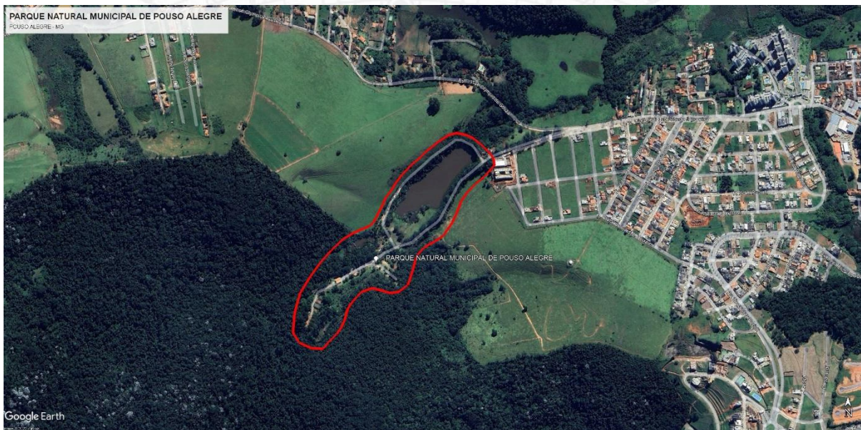
Figura 2 – Área de Abrangência do Projeto.

8.1. Os serviços serão executados na Avenida Waldemar de Azevedo Junqueira, no município de Pouso Alegre - MG, conforme figura a seguir.