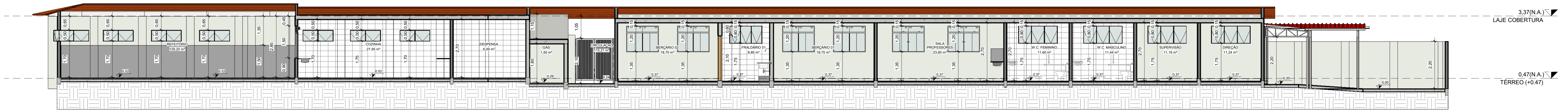
1 CORTE D-D 1:75