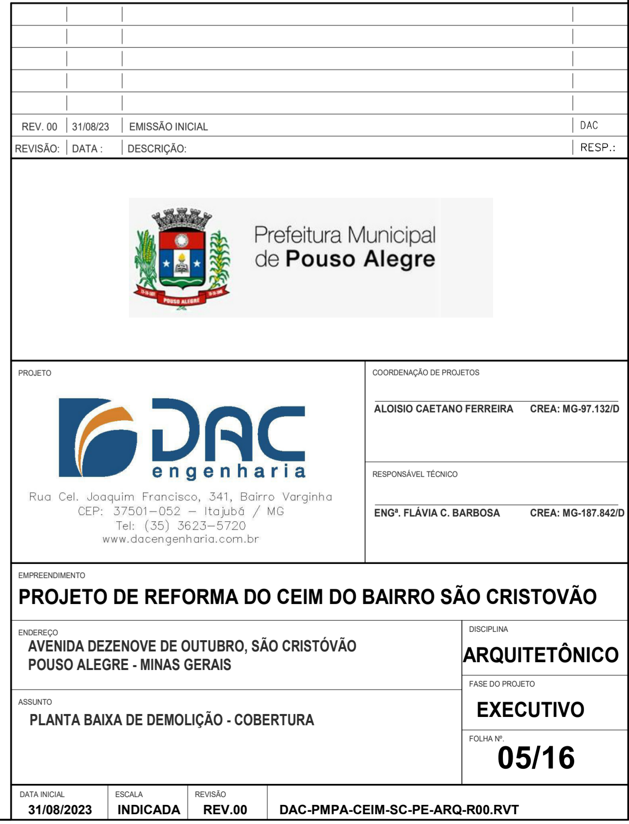
1 PLANTA BAIXA COBERTURA - DEMOLIÇÃO 1 : 75