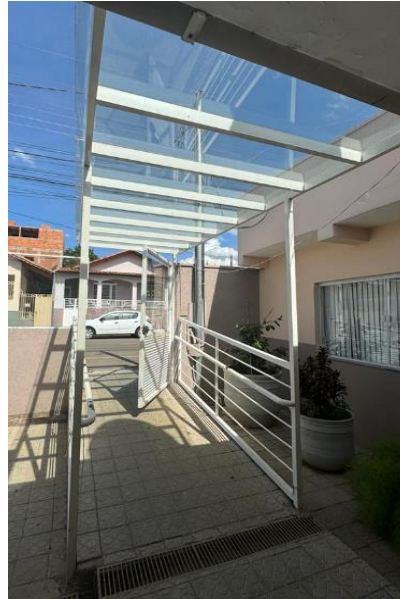
Figura 1: Imagem da cobertura.

cobertura é composta por uma estrutura metálica pintada na cor branca, com um telhado feito de placas acrílicas transparentes.