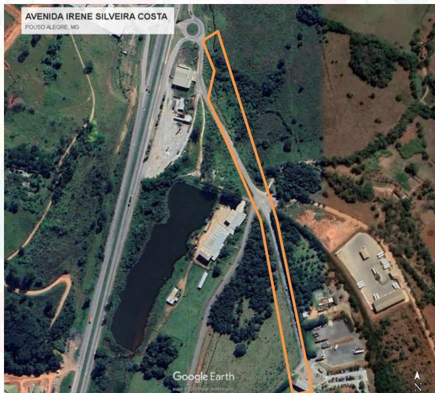
Figura 1 – Área de Abrangência do Projeto.

14.1. Os serviços serão executados na Avenida Irene Silveira Costa, no município de Pouso Alegre - MG, conforme figura a seguir.