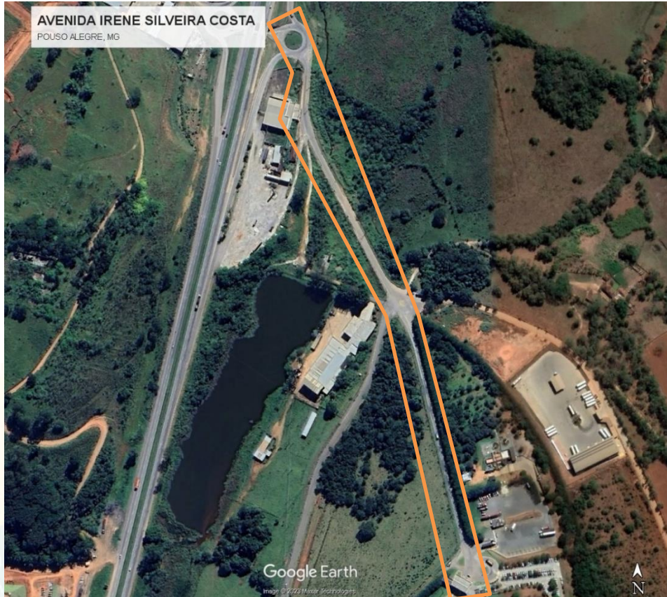
Figura 2 – Área de Abrangência do Projeto.

8.1. Os serviços serão executados na Avenida Irene Silveira Costa, no município de Pouso Alegre - MG, conforme figura a seguir.