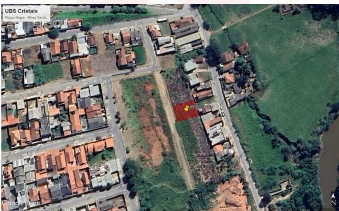
Figura 1 - Local da implantação da edificação

14.1 A construção da Unidade Básica de Saúde Cristais será executada na Rua Roberto Scodeler, Bela Itália, município de Pouso Alegre nas coordenadas – 22203753, - 45.899745.