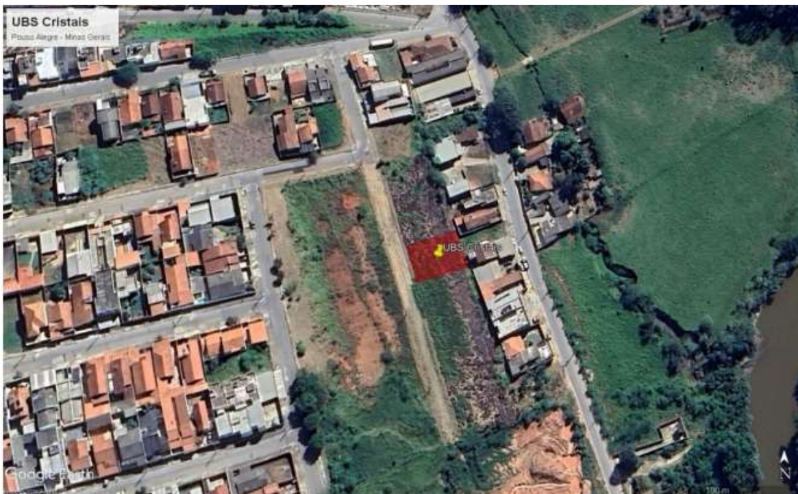
Figura 1 - Local da implantação da edificação